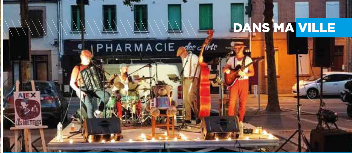
3 ÈME ÉDITION DES ESCALES GOURMANDES