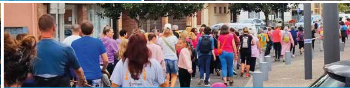
LA SEIN'GULIÈRE #01 - OCTOBRE ROSE