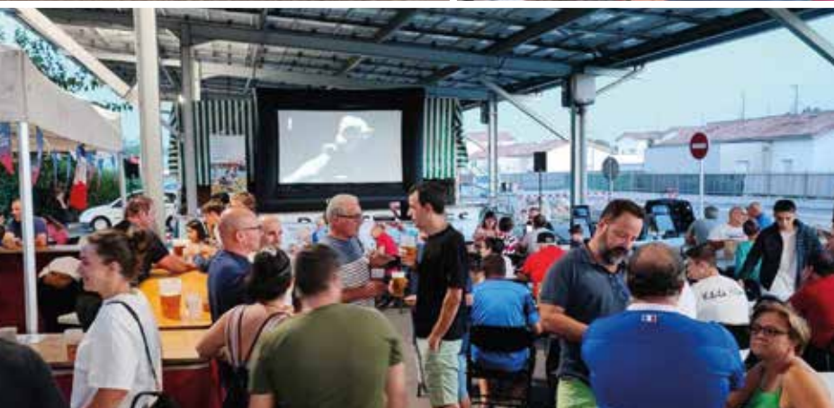
RWC 2023 : RETRANSMISSION DES MATCHS DE L'ÉQUIPE DE FRANCE