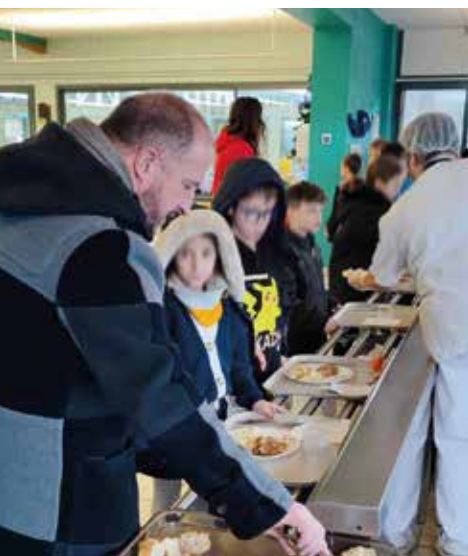
RENCONTRES INTERGÉNÉRATIONNELLES ÉCOLE LOUISE MICHEL