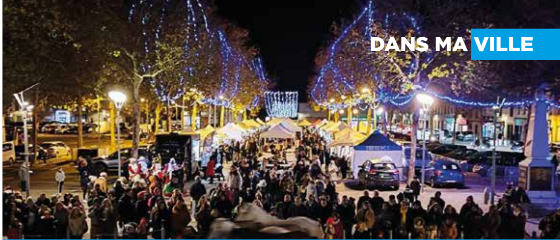
MARCHÉ DE NOËL ORGANISÉ PAR L'ASSOCIATION LES VIE-TRINES DU CENTRE