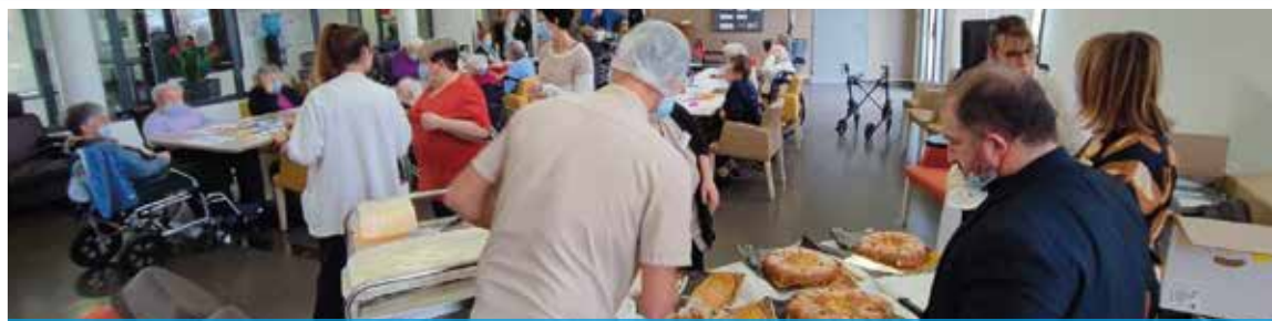
LA GALETTE DES ROIS OFFERTE PAR LA MUNICIPALITÉ AUX EHPAD PUBLICS