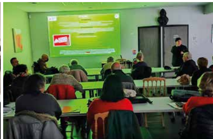
ATELIERS NUMÉRIQUES DU CCAS