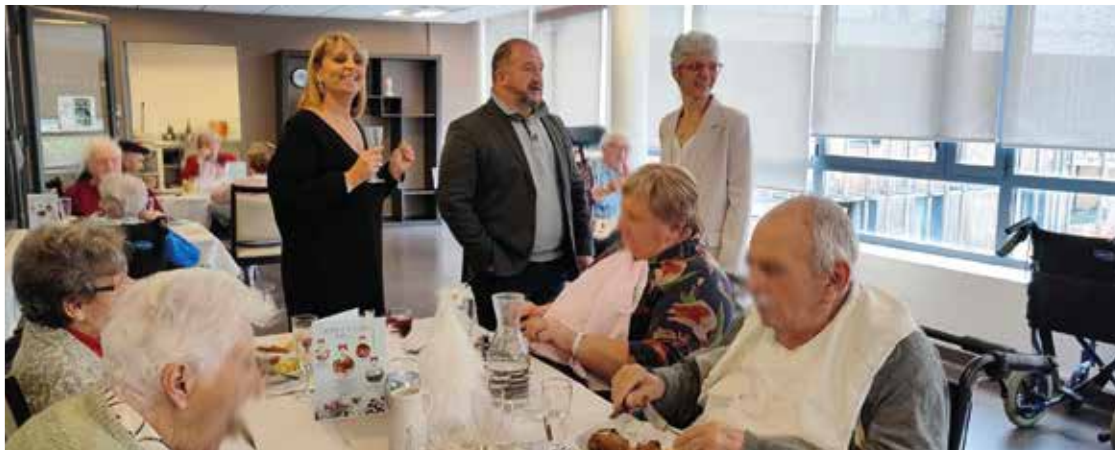
REPAS DE NOËL DANS LES EHPAD PUBLICS