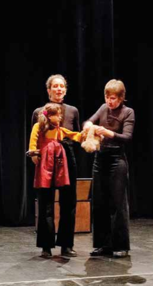
BEURK ! UN SPECTACLE SUR LE CONSENTEMENT