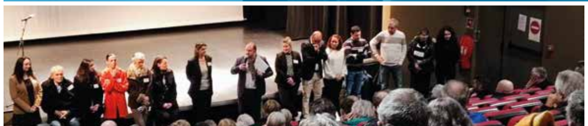
CÉRÉMONIE DES VŒUX DU CONSEIL MUNICIPAL