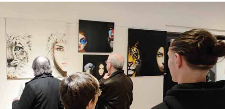
EXPOSITION JEAN-FRANÇOIS ROUSSELOT