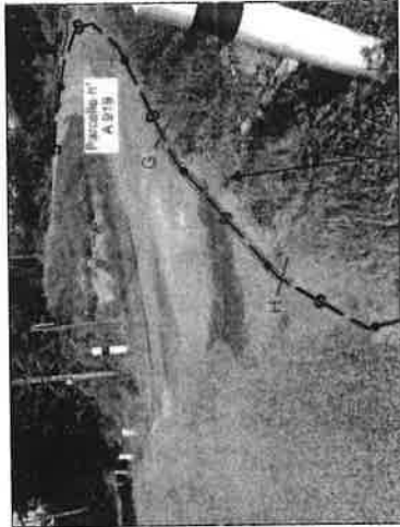
Passage sur busage en sous profondeur prevoir plaque de protection mécanique